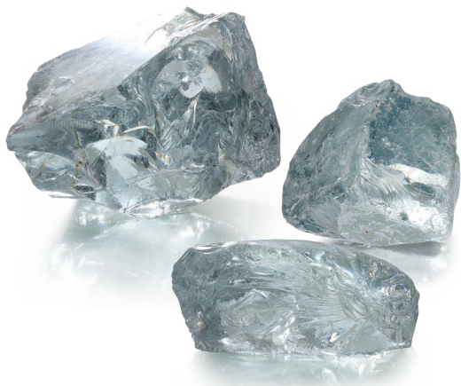
CP-12L クリスタルクリア (Cクリア) Crystal Clear