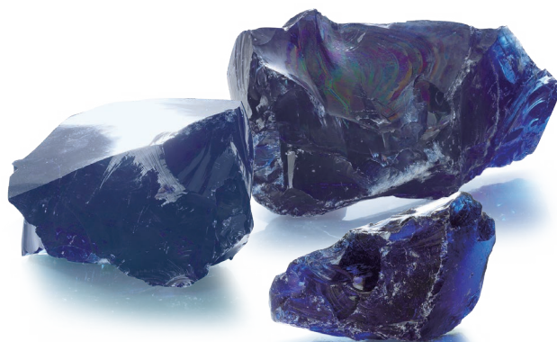
CP-14L サファイアブルー (Sブルー) Sapphire Blue