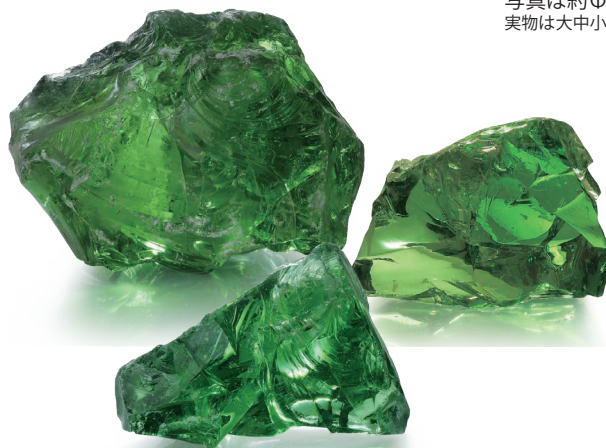
CP-13L ガーネットグリーン (Gグリーン) Garnet Green