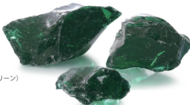
CP-15L エメラルドグリーン (Eグリーン) Emerald Green