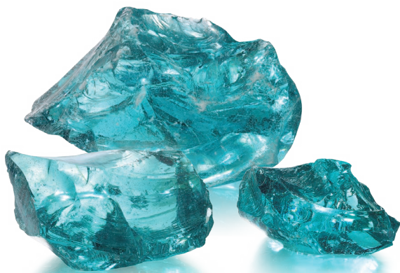
CP-11L トルマリンプルー (Tブルー) Tourmaline